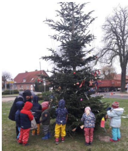
Die Kita Purzelbäume beim Tannenbaum schmücken mit selbstgebastelten Kerzen und Glocken