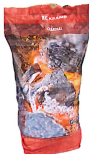
Grillkohle 10 kg