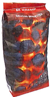
Grillbriketts 10 kg

Große Auswahl an Weidezaun-Geräten und Zubehör in unserem Landmaschinenlager.